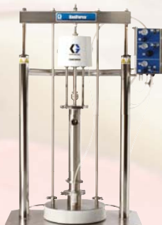
SaniForce 5:1 Urządzenie do rozładowywania zbiorników