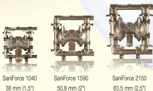
SaniForce 1040 38 mm (1,5")