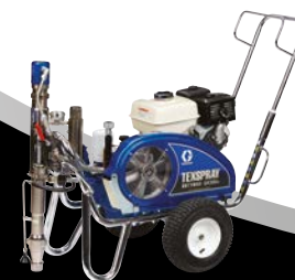
DUTYMAX™ EH230DI STANDARD